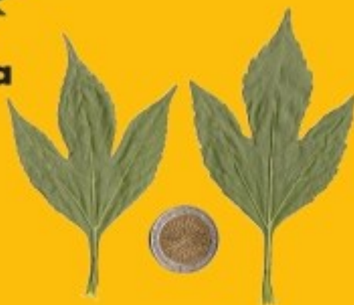
3 trifida De grande taille, de 1 à 5 lobes