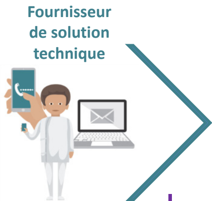
Schéma de facturation expérimentation de télésurveillance